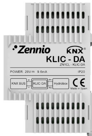
Figura 1. KLIC-DA

Como interfaz bidireccional KNX / Altherma , el KLIC-DA proporciona una comunicación completa entre cualquier dispositivo KNX (como por ejemplo la pantalla táctil InZennio Z41, de Zennio) y el sistema Altherma, que podrá entonces controlarse de forma análoga a como se haría desde sus propias interfaces de usuario. Además, las actualizaciones de estado y en general toda la retroalimentación recibida desde el sistema Altherma podrán ser redirigidas por el KLIC-DA hacia el resto de los dispositivos KNX.