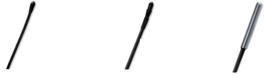
Рисунок 1: ZAC-NTC68S/E/F